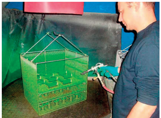
Fluorescent penetrant inspection Ressuage fluorescent

Non Destructive Testing processes certified by PRI Nadcap Procédés de contrôle non destructifs certifiés selon normes PRI- Nadcap