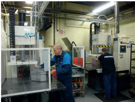
Semi-automatic wax injection devices Presses d'injection cire semi-automatiques