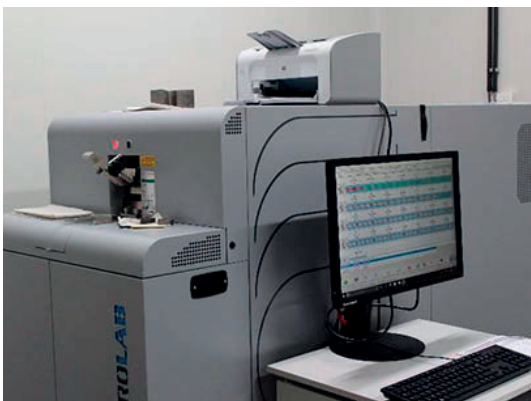
Spectrometric steel chemical analyser Analyse chimique des aciers par spectrométrie