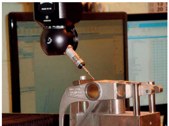
Robotized 3D measurement machine Machine de mesure tridimensionnelle CNC