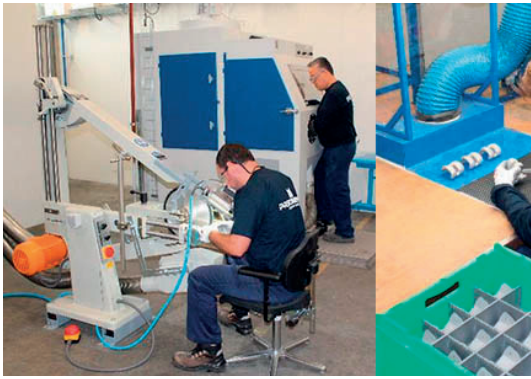
Dedicated finishing workshop for orthopedic implants – certified ISO 13485 Atelier de finition dédié pour implants orthopédiques – certification ISO 13485