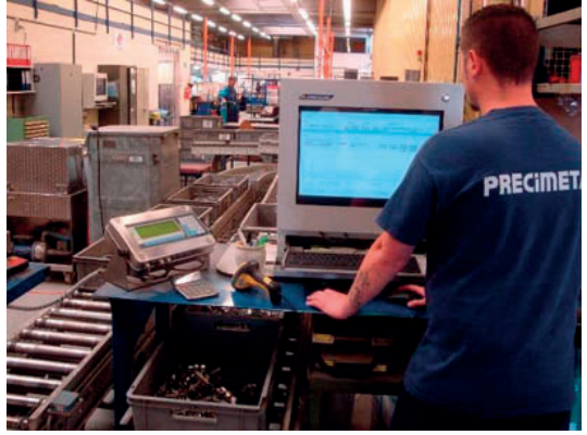
Upgrade workshop flow management system Mise à niveau système de gestion de flux atelier