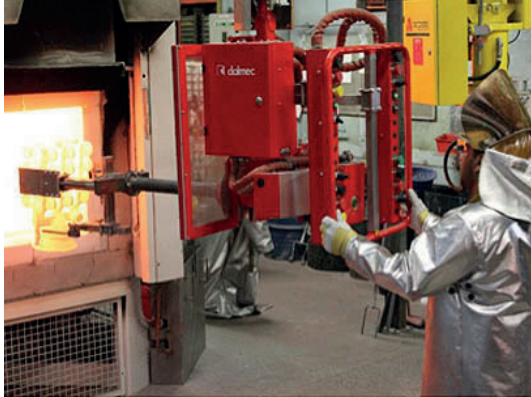
Two firing and melting lines with 25kg roll over and from 120 to 180 kg conventional furnaces Double ligne de cuisson et fusion avec four à retournement de 25kg et conventionnels de 120 à 180kg