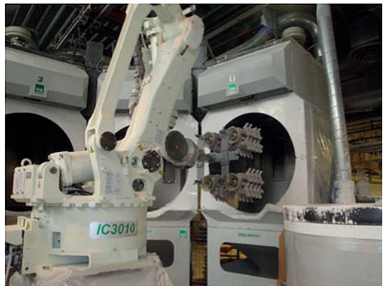
Robotized shell room Atelier revêtement robotisé